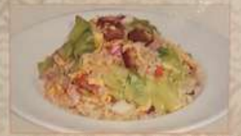
100. 五目入りチャーハン ¥1.280 什錦炒飯 ..... (税込) Fried rice