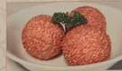
117. 黒ごま団子揚げ 芝麻球 (3個) ..... ¥980 Fried sesame balls (税込)