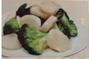
75. タテとブロッコリ塩味炒め 花鮮貝 ¥1,580 (税込) Fried scallops and broccoli with salt