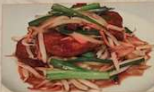
46. 豚レバーとニラの炒め ¥1,080 (税込) 生炒豬肝 Stir-fried pork liver and Chinese chives