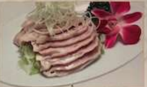
17. 蒸し若鶏と長葱油かけ ¥1,080 (税込) 蔥油雞 Steamed chicken with leek and oil