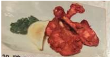
39. 鶏の手羽先 ..... ¥980 (税込) 香炸雞翅根 (チューリップ3本) Fried tulip chicken wings