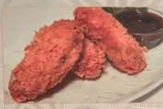
74. ジャンボカキフライ ¥1,080 (税込) 台式牡蠣 (3個) Deep fried oysters