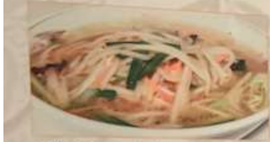
85. もやし入り塩味ラーメン 豆芽湯麺 ..... ¥1.180 (税込) Bean sprouts Shio-Ramen