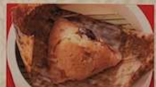
123. 旺旺特製チマキ ..... ¥580 (税込) 台湾粽子 (1個) Sticky rice wrapped in bamboo leaf