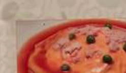
34. カニと玉子焼き ¥1,380 (税込) 蟹肉炒蛋 Crab meat omelet