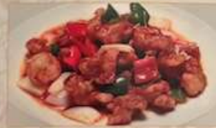
40. 鶏肉とピーマンの唐辛子炒め 辣子雞丁 ¥1,180 (税込) Stir-fried chicken and green pepper with chili