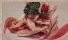
10. タケノコの塩味揚げ ¥780 (税込) 干焼冬菇 Deep fried bamboo shoot with salt