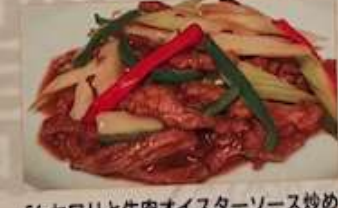
56. セロリと牛肉オイスターソース炒め 茜芹牛肉 ..... ¥1.280 (税込) Stir-fried beef & celery with oyster sauce