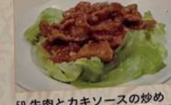
59. 牛肉とカキソースの炒め 蠔油牛肉片 ..... ¥1.480 (税込) Stir-fried beef with oyster