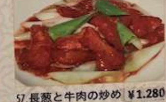
57. 長葱と牛肉の炒め ¥1.280 (税込) 蔥爆牛肉 Stir-fried beef and leek