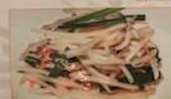
23. もやしとニラの塩味炒め 生炒豆芽 ¥1,080 (税込) Stir-fried bean sprouts with Chinese chives