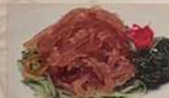
12. くらげの味付け ¥880 (税込) 海蜇皮 Jellyfish cold dish