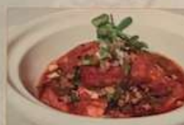
31. 揚げ豆腐と高菜の辛子土鍋煮込み ¥1,480 (税込) 高菜豆腐 Tofu hot pot with pickle & mustard green