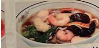
91. 五目野菜入りうま煮ラーメン 什錦湯麺 ..... ¥1.180 (税込) Gomoku Ramen