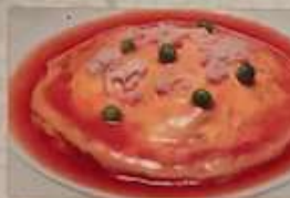
34. カニと玉子焼き ¥1,380 (税込) 蟹肉炒蛋 Crab meat omelet