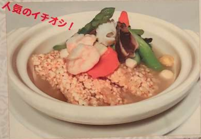
78. 海鮮入りおこげ ¥1,980 (税込) 海鮮鍋粿 Scorched rice with seafood sauce