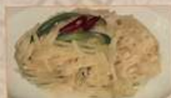
24. ジャガ芋細切りのお酢炒め 生炒土豆絲 ..... ¥1,080 (税込) Stir-fried shredded potato with vinegar