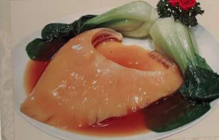
79. フカヒレの姿醤油煮 ¥12,000 (税込) 紅燒排翅 Braised whole shark's fin in soy sauce