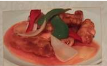
49. 甘酢スプタ ..... ¥1.180 (税込) 咕咾肉 Sweet and sour pork