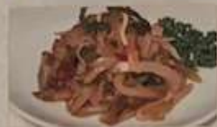
1. ザーサイ ¥460 (税込) 榨菜 Zosai pickles