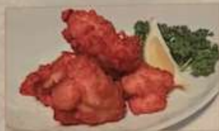
37. 若鶏の香味揚げ ¥980 (税込) 香炸雞塊 Fried spring chicken