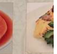
35. ゴーヤ苦瓜炒蛋 ¥1,080 (税込) 苦瓜炒蛋 Stir-fried egg