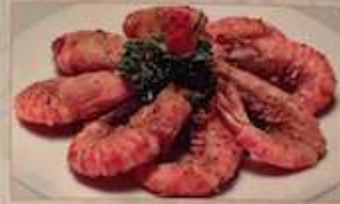
71. 車エビと塩胡椒の唐辛子炒め 塩酥蝦仁 ..... ¥1.680 (税込) Stir-fried shrimps and chili with pepper & salt.