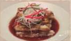
21. 揚げナス ¥1,280 (税込) 油淋茄子 Deep fried eggplant with sour soy sauce