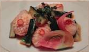
13. イカとキュウリの和え物 ¥880 (税込) 花枝拌黄瓜 Squid and cucumber cold dish