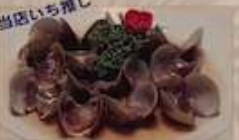
11. 生しじみの醤油味付け ¥780 (税込) 海瓜子 Freshwater clams in soy sauce