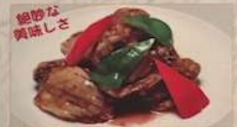
77. 揚げカキとバリバリのナス炒め 牡蠣茄子 ..... ¥1.680 (税込) Fried oyster and eggplant.