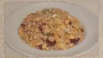
96. チャーシューチャーハン ¥1.180 叉焼炒飯 ..... (税込) Fried rice with B.B.Q.pork