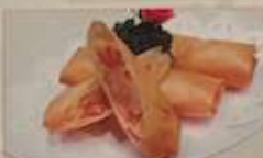
112. エビ入り揚げ巻 蝦仁春巻 (3本) ¥980 Shrimp spring rolls (税込)