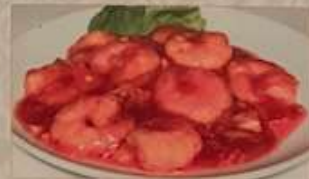
68. エビのチリソース炒め 乾燒蝦仁 ..... ¥1.380 (税込) Stir-fried shrimps with chili sauce.