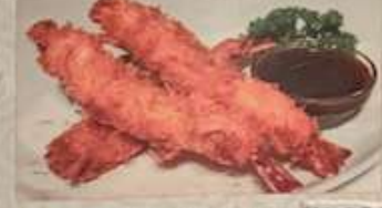
73. エビフライ (大3本) ¥1.080 台式炸蝦 (税込) Deep fried prawns.