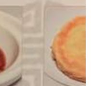
32. 台湾風菜脯蛋 菜脯蛋 Taiwanese omelet