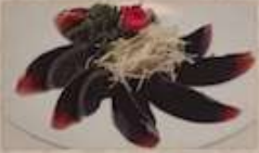
3. ビータン ¥560 (税込) 皮蛋 Preserved duck egg