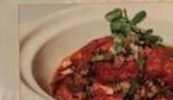
31. 揚げ豆腐と高菜の辛子土鍋煮込み 高菜豆腐 ¥1,480 (税込) Tofu hot pot with pickled mustard green