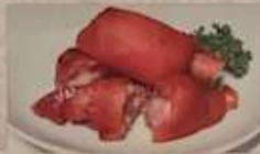
6. 豚の足醤油味 ¥680 (税込) 猪足 Pork leg simmered in soy sauce