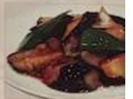
20. ナスと豚肉の台湾家郷茄子 ¥1,180 (税込) 家郷茄子 Stir-fried eggplant & pork