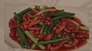
55. ニンニク芽と牛肉オイスターソース炒め 蒜苗牛肉 ¥1,280 (税込) Stir-fried beef & garlic buds with oyster sauce