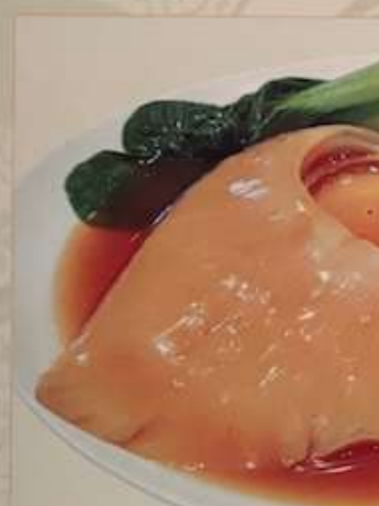
79. フカヒシの姿醬油煮 ¥12.000 (税込) 紅燒排翅 Braised whole shark's fin.