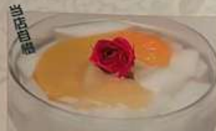
127. 自家製アナン豆腐 ¥680 (税込) 杏仁豆腐 Home made almond jelly