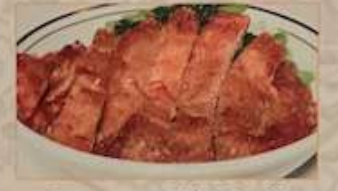
103. 豚ロースの唐揚げご飯 ¥1.280 (税込) 排骨飯 ..... Fried spare ribs on rice