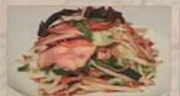
27. 豚肉と五目野菜炒め ¥1,080 (税込) 青菜炒肉片 Stir-fried mixed vegetable with pork