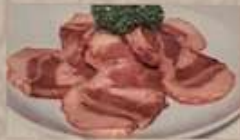
9. チャーシュー肉 ¥780 (税込) 叉焼肉 B.B.Q. pork