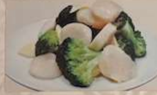
64. ホタテとブロッコリ塩味炒め 蘭花鮮貝 ..... ¥1.580 (税込) Stir-fried scallops and broccoli with salt.