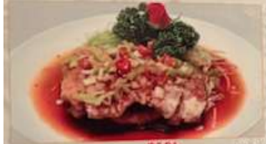
41. 鶏肉の唐揚げ油淋ソースかけ 油淋雞 ..... ¥1.480 (税込) Fried chicken with sour soy sauce