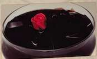
125. 台湾黒ゼリー ..... ¥580 (税込) 仙草 Taiwan herb jelly