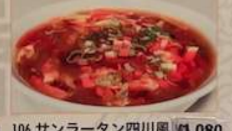
106. サンラータン四川風 ¥1.080 酸辣湯 (税込) Hot and sour soup