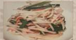
23. もやしとニラの塩味炒め ¥1,080 (税込) 生炒豆芽 Stir-fried bean sprouts with Chinese covers