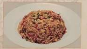
101. 台湾頂極ピリ最高チャーハン 台湾澎湖炒飯 ..... ¥1.180 Taiwan Saiko fried rice (税込)