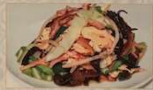
44. 豚肉とキクラゲと玉子の炒め 木須肉 ¥1,080 (税込) Stir-fried pork and Kikurage with egg