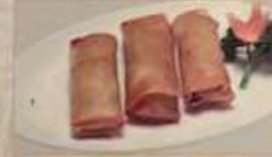
118. 野菜入りハルマキ 青菜春巻 (3本) ¥880 Spring rolls (税込)