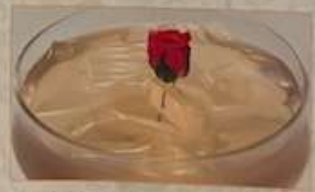
126. 台湾黄金ゼリー ¥580 (税込) 愛玉 Taiwan lemon jelly