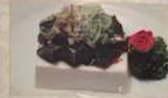
4. ビータン豆腐 ¥780 (税込) 皮蛋豆腐 Tofu with preserved duck egg