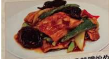
45. 豚肉とキャベツの味噌炒め 回鍋肉 ..... ¥1.080 (税込) Stir-fried pork & cabbage with hot bean sauce