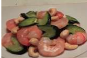
77. エビとカシューナッツ炒め 腰果蝦仁 ¥1,380 (税込) Stir-fried shrimps and cashew nuts