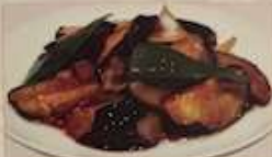
20. ナスと豚肉の台湾風炒め 家郷茄子 ¥1,180 (税込) Stir-fried eggplant & pork