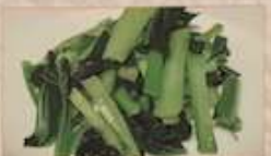
25. 小松菜の塩味炒め 蒜炒小松菜 ..... ¥1,080 (税込) Stir-fried Komatsuna vegetable with garlic