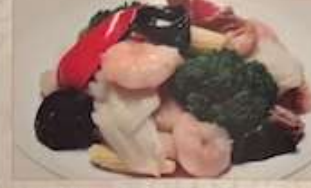
63. 海鮮と野菜入り八寶菜 ¥1.280 八寶菜 (税込) Seafood chop suey.