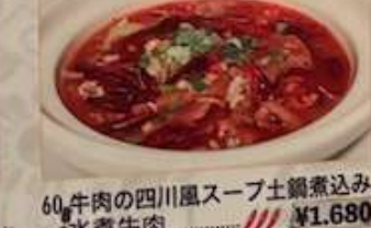
60. 牛肉の四川風スープ土鍋煮込み 水煮牛肉 ..... ¥1.680 (税込) Stewed beef in chili soup