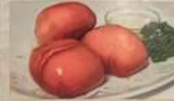
114. 中華ミルク揚げパン ¥780 牛乳包子 (3個) (税込) Chinese fried milk buns