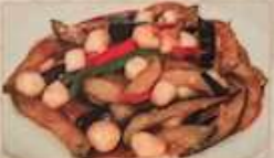
22. 小貝柱とナスの炒め 鮮貝茄子 ¥1,380 (税込) Stir-fried eggplant with baby scallops