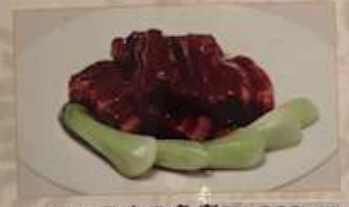
52. 豚バラ肉の角煮 ¥1.280 (税込) 紅燒肉 Braised pork cubes