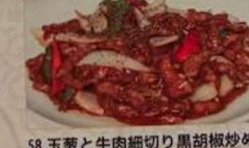
58. 玉葱と牛肉細切り黒胡椒炒め 黒椒牛肉絲 ..... ¥1.280 (税込) Stir-fried beef and onion with black pepper