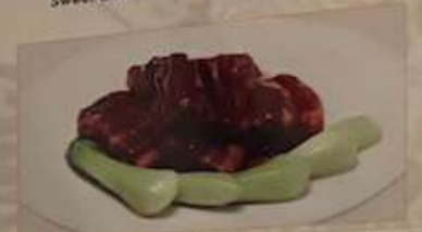
52. 豚バラ肉の角煮 ¥1,280 (税込) 紅燒肉 Braised pork cubes