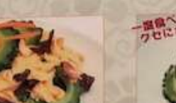
36. 塩鴨玉子とゴーヤ塩味炒め 咸蛋苦瓜 ¥1,180 (税込) Stir-fried salty duck egg