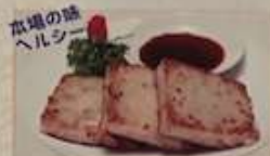
111. 自家製大根もち 蘿蔔糕 (3枚) ..... ¥880 Home made redish cakes (税込)