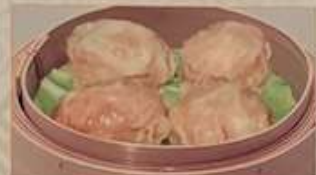
119. 自家製しゅうまい 焼賣 (4個) ..... ¥880 (税込) Home made dim sum