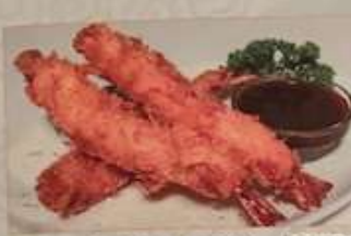
73. エビフライ (大3本) ¥1,080 (税込) 台式炸蝦 Deep fried prawns