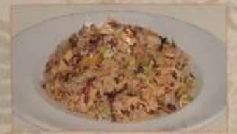
99. 高菜入りチャーハン ¥1.180 高菜炒飯 ..... (税込) Fried rice with pickled mustard green