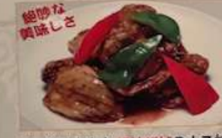
77. 揚げカキとバリバリのナス炒め 牡蠣茄子 ¥1,680 (税込) Fried oyster and eggplant