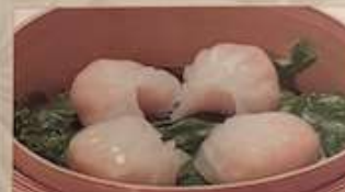
121. エビフリフリ蒸し餃子 ¥1,180 蝦餃 (4個) (税込) Steamed shrimp dumplings