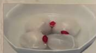
124. 台湾タンエン (温) ..... ¥680 (税込) 台湾湯圓 Taiwan rice balls in hot sweet soup