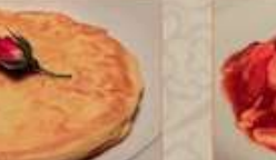
33. トマトと玉子の塩味炒め ¥1,180 (税込) 蕃茄炒蛋 Stir-fried egg with tomato