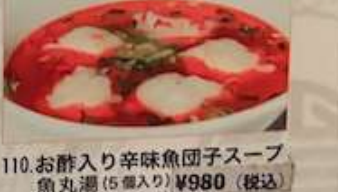
110. お酢入り辛味魚団子スープ 魚丸湯 (5個入り) ¥980 (税込) Hot and sour soup with fish balls