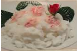
76. カニと卵白の炒め ¥1,580 (税込) 芙蓉蟹肉 Stir-fried crab meat and egg white