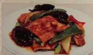
45. 豚肉とキャベツの味噌炒め 回鍋肉 ¥1,080 (税込) Stir-fried pork & cabbage with Hot Bean Sauce