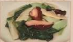
26. チンゲン菜と椎茸炒め 冬菇菜心 ¥1,080 (税込) Stir-fried green Chinese mushroom