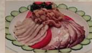
18. 前菜の三種盛り合せ ¥1,980 (税込) 三色冷盤 (叉焼、蒸し若鶏、くらげ) B.B.Q. pork, Steamed chicken & Jellyfish cold dish