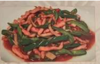
50. 豚肉とピーマン細切り炒め 青椒肉絲 ..... ¥1.180 (税込) Stir-fried shredded pork and green pepper