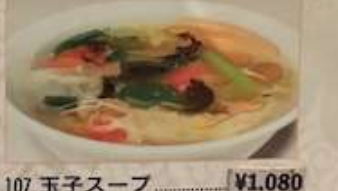
107. 玉子スープ ..... ¥1.080 雞蛋湯 (税込) Egg flower soup