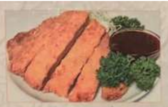
51. カレー風味の豚ロース揚げ 咖喱豬排 ..... ¥1.280 (税込) Fried spare ribs flavored with curry