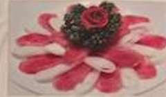
8. 台湾の本格腸詰め ¥680 (税込) 香腸 Taiwanese sausage