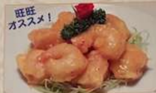
70. エビとマヨネーズ和え 富貴蝦仁 ..... ¥1.480 (税込) Shrimps in mayonnaise sauce.