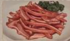
5. 豚の耳醤油味 ¥680 (税込) 猪耳 Pork ear flavored with soy sauce