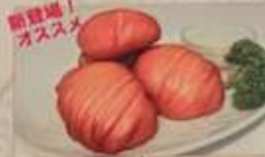
113. 花巻揚げパン ¥780 花巻 (3個) (税込) Chinese fried buns