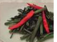
28. グウシン菜の塩味炒め ¥1,080 (税込) 蒜炒空心菜 Stir-fried water spinach with chili