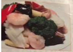
72. 海鮮と野菜入り八宝菜 ¥1,280 (税込) 海鮮八宝菜 Seafood chop suey