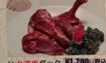
54. 台湾風ダック ¥1.780 (税込) 燒鴨 Taiwanese roasted duck