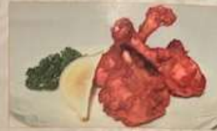
39. 鶏の手羽先 ¥980 (税込) 香炸雞翅根 (チュールリップ 3本) Fried tulip chicken wings