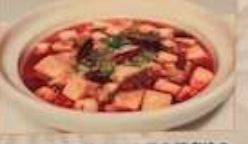
30. 豆腐と豚挽肉の辛子土鍋煮込み 麻婆豆腐 ¥1,380 (税込) Ma Po tofu