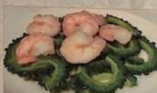
72. エビとゴーヤ塩味炒め 蝦仁苦瓜 ..... ¥1.380 (税込) Stir-fried shrimps and bitter melon with salt.