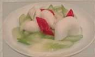
61. イカとセロリの炒め ¥1.280 茜芹魷魚 (税込) Stir-fried squid and celery.