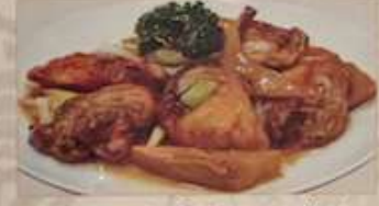
76. カキとネギポイルの炒め 蔥爆牡蠣 ..... ¥1.480 (税込) Fried oyster and leek.