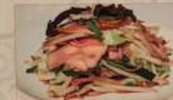
27. 豚肉と五目野菜炒め 青菜炒肉片 ..... ¥1,080 (税込) Stir-fried mixed vegetable with pork