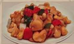
43. 鶏肉とカシューナッツの炒め 腰果雞丁 ¥1,180 (税込) Stir-fried chicken and cashew nuts