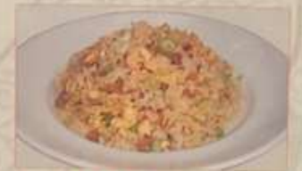
98. 台湾干し大根入りチャーハン 台湾蘿蔔絲炒飯 ..... ¥1.180 Fried rice with dried radish (税込)