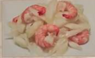
62. エビとセロリの炒め ¥1.280 茜芹蝦仁 (税込) Stir-fried shrimps and celery.