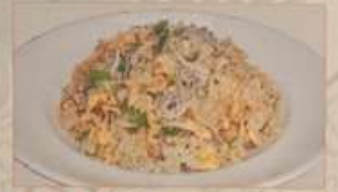
97. しらす入りチャーハン ¥1.180 小沙丁魚炒飯 ..... (税込) Fried rice with baby sardine