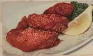
38. 鶏のゴマ手羽先 (3本) ¥980 (税込) 芝麻雞翅 Fried chicken wings with sesame