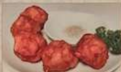
116. イカ団子揚げ 花枝丸子 (5個) ¥980 Fried squid balls (税込)