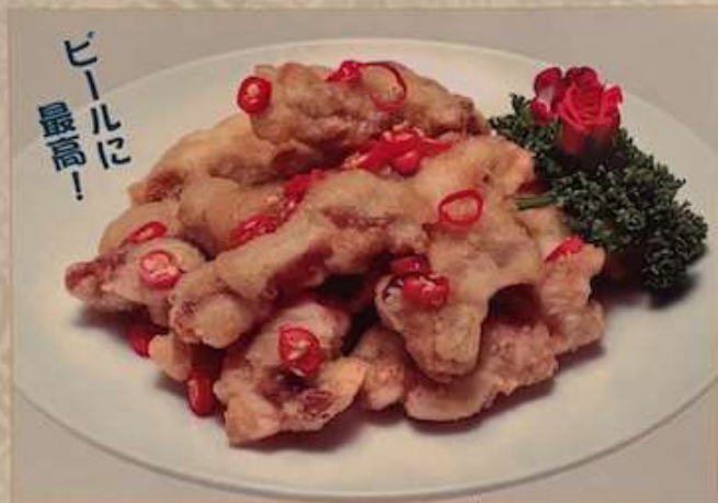
42. 台湾屋台風鶏肉のピリ辛唐揚げ ¥1,280 (税込) 塩酥雞 Fried chicken with chili