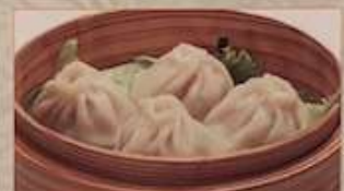
120. 熱々の肉汁いっぱいショウロンポウ 小籠包 (4個) ..... ¥1,180 (税込) Steamed soup dumplings