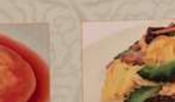
35. ゴーヤと玉子炒め ¥1,180 (税込) 苦瓜炒蛋 Stir-fried egg with bitter melon