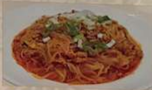
48. 豚挽肉と春雨の辛子炒め 春雨旺旺肉 ¥1,080 (税込) Stir-fried minced pork & sour-sour vermicelli