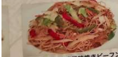
94. 野菜入り台湾風味焼きビーフン 海鮮入りは +¥220 ¥1.180 (税込) 炒米粉