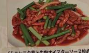
55. ニンニク芽と牛肉オイスターソース炒め 蒜苗牛肉 ..... ¥1.280 (税込) Stir-fried beef & garlic buds with oyster sauce