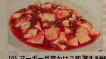
105. マーボー豆腐かけご飯 ¥1.180 麻婆燴飯 (税込) Ma Po tofu on rice