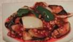
19. ナスと豚挽肉の唐辛子炒め 麻婆茄子 ..... ¥1,180 (税込) Stir-fried eggplant & pork with chili