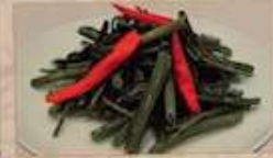
28. クウシン菜の塩味炒め 蒜炒空心菜 ..... ¥1,280 (税込) Stir-fried water spinach with salt