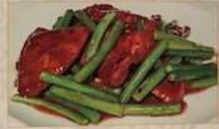
47. 豚レバーとニンニク芽炒め 蒜苗豬肝 ¥1,180 (税込) Stir-fried pork liver and garlic buds