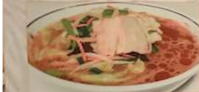
88. 野菜入りみそラーメン ¥1.180 味噌湯麺 ..... (税込) Miso Ramen with vegetables