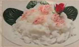
65. カニと卵白の炒め ¥1.580 芙蓉蟹肉 (税込) Stir-fried crab meat and egg white.