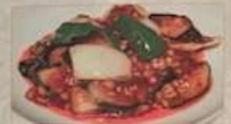
19. ナスと豚挽肉の唐辛子炒め ¥1,180 (税込) 麻婆茄子 Stir-fried eggplant & pork with chili