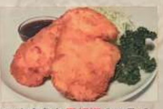
75. 白身魚と黒胡椒のフライ 香炸魚排 ¥1,680 (税込) Deep fried fish fillet with black pepper