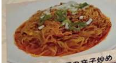
48. 豚挽肉と春雨の辛子炒め ..... ¥1.080 (税込)