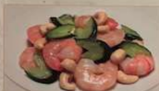
69. エビとカシューナッツ炒め 腰果蝦仁 ..... ¥1.380 (税込) Stir-fried shrimps and cashew nuts.