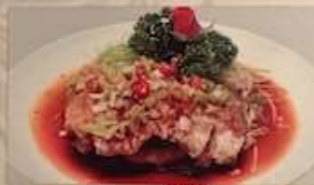
41. 鶏肉の唐揚げ油淋ソースかけ 油淋雞 ¥1,480 (税込) Fried chicken with sour soy sauce