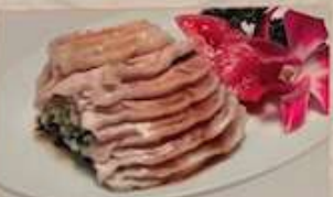
16. 蒸し若鶏のゴマ辛味ソースかけ ¥1,080 (税込) 棒棒雞 Steamed chicken with nori sesame sauce