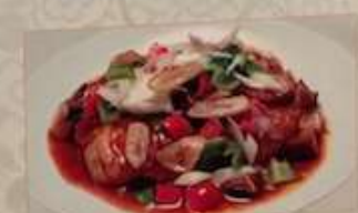
81. 白身魚と四川豆板醤煮込み 豆瓣魚 ¥1,680 (税込) Fish fillet in Sichuan chili bean sauce