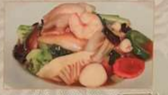
104. 野菜うま煮かけご飯 ¥1.280 中華燴飯 (税込) Chop suey on rice