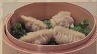
122. フカヒレ蒸し餃子 ¥1,180 魚翅餃 (4個) (税込) Steamed shark's fin dumplings