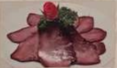
7. 豚の舌醤油味 ¥780 (税込) 猪舌 Pork tongue simmered in soy sauce