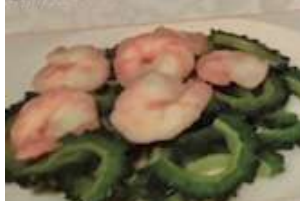
78. エビとゴーヤ塩味炒め 蝦仁苦瓜 ¥1,380 (税込)