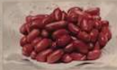
2. ピーナッツの香り揚げ (塩味) ¥480 (税込) 香酥花生 Fried peanuts with chili