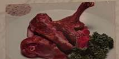
54. 台湾風ダック ¥1,780 (税込) 燒鴨 Taiwanese roasted duck