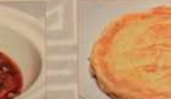
32. 台湾風干し大根入り玉子焼き 菜脯蛋 ..... ¥1,180 (税込) Taiwan omelet with dried radish