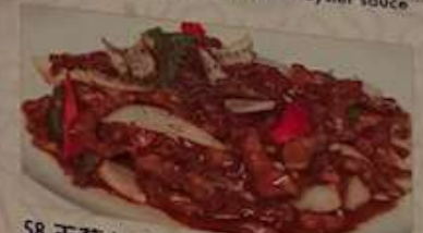
58. 玉葱と牛肉細切り 黒胡椒炒め 黑椒牛肉絲 Stir-fried beef with black pepper