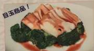
80. アワビの醤油煮 ¥2,980 (税込) 紅燒小鮑魚 Braised abalone in soy sauce