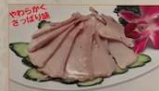
15. 冷やしアワビ ¥1,380 (税込) 凉拌鮑魚 Abalone cold dish