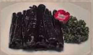
14. キュウリの甘酢漬け ¥880 (税込) 蜜汁瓜條 Cucumber pickles