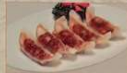
115. 自家製焼き餃子 焼餃子 (5個) ¥580 (税込) Home made pan-fried dumplings