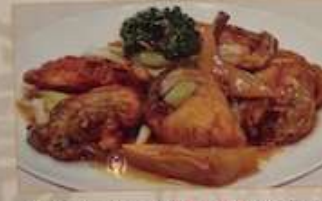
76. カキとネギポイルの炒め 蔥爆牡蠣 ¥1,480 (税込) Fried oyster and leek