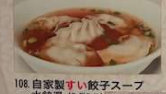
108. 自家製すい餃子スープ 水餃湯 (5個入り) ¥980 (税込) Home made dumpling soup