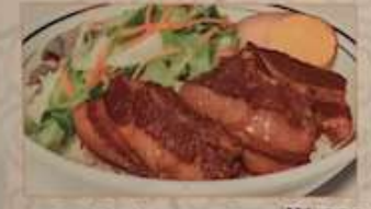
102. 豚肉角煮かけご飯 ..... ¥1.180 滷肉飯 元祖! 創業の一品 (税込) Braised pork on rice