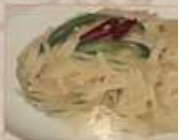
24. ジャガ芋細切りのお生炒土豆絲 ¥1,080 (税込) 生炒土豆絲 Stir-fried shredded potato with chili