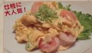
67. エビとトロトロの玉子焼き 滑蛋蝦仁 ..... ¥1.280 (税込) Stir-fried shrimps and egg.