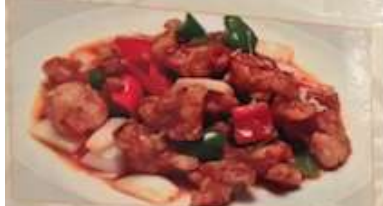
40. 鶏肉とピーマンの唐辛子炒め 辣子雞丁 // ..... ¥1.180 (税込) Stir-fried chicken and green pepper with chili