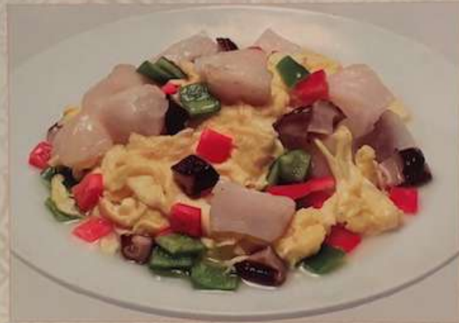
66. ホタテと玉子入り塩味炒め 桂花鮮貝 ..... ¥1.480 (税込) Stir-fried scallops and egg with salt.