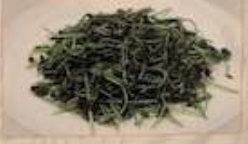
29. マメ菜の塩味炒め 蒜炒豆苗 ¥1,180 (税込) Stir-fried green pea sprouts with salt