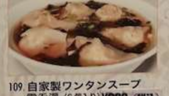
109. 自家製ワンタンスープ 雲吞湯 (6個入り) ¥980 (税込) Home made wonton soup