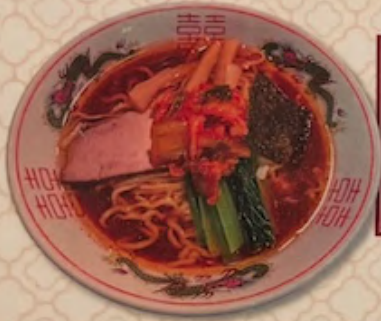
キムチ油ラーメン