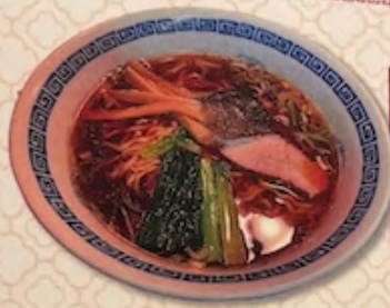
しょうゆラーメン