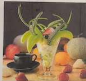
マスクメロンパフェ