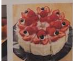
いちごフルーツショートケーキ