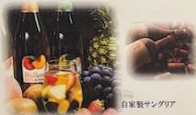
自家製サンクリア