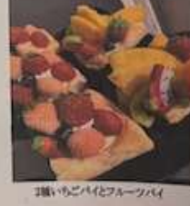
いちごパイとフルーツパイ