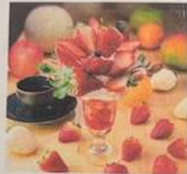
いちごパフェ ※季節により価格変動いたします