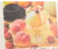
夏季 季節パフェ ももパフェ