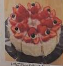
いちごショートケーキ