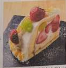
いちごチェインマスカルポーネオレンジムース