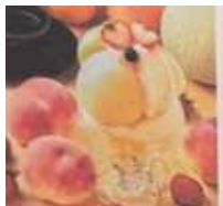
夏季 季節パフェ ももパフェ