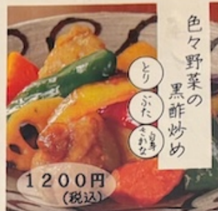
stir-fried vegetables with vinegar