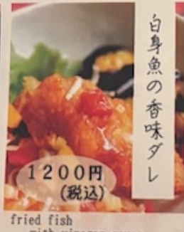
fried fish with vinegar sauce