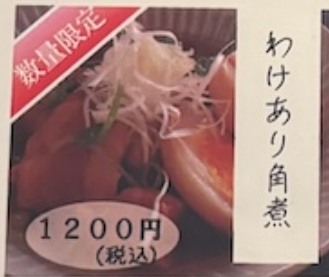
leftover pieces of boiled pork