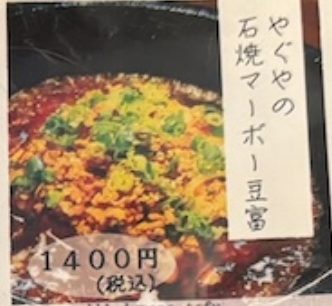
stone-grilled mapo tofu