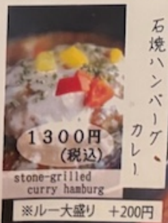
stone-grilled curry hamburger