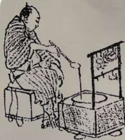
葛飾北斎(1760~1849) 「北斎漫画」より