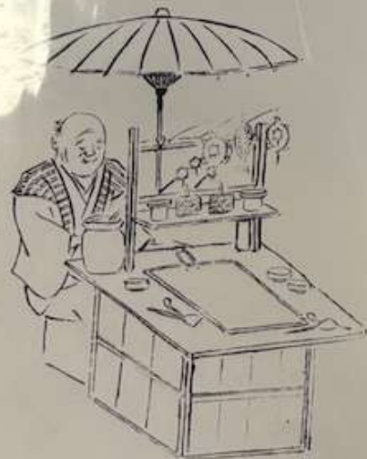
清水晴風(1851~1913) 「世渡風俗圖會」より