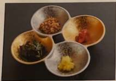
四味彩 二〇〇円 税込二二〇円