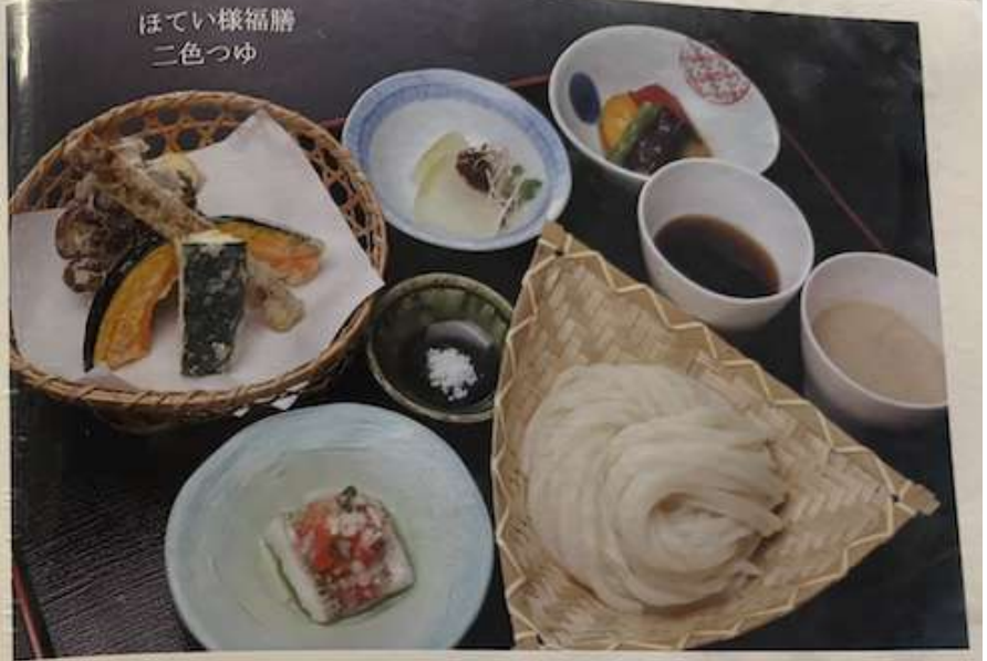
ほてい様福膳 二色つゆ