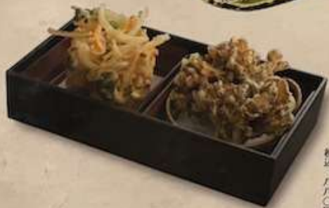
合わせ盛り 八〇〇円 税込七八〇円