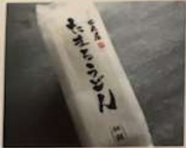
たまるうどん 特別細麺 2人前 648円 (税込)

広島県三國屋のばら干し焼き海苔と うまみの強いだし汁が作り上げた香りとお楽しみください。