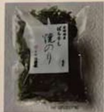
ばら干し焼きのり 198円 (税込)