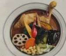
パリパリ or 柔らか Crispy or Tender