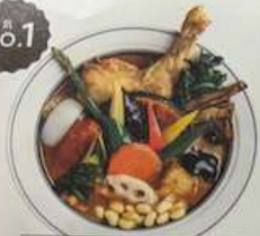
パリパリ or 柔らか Crispy or Tender